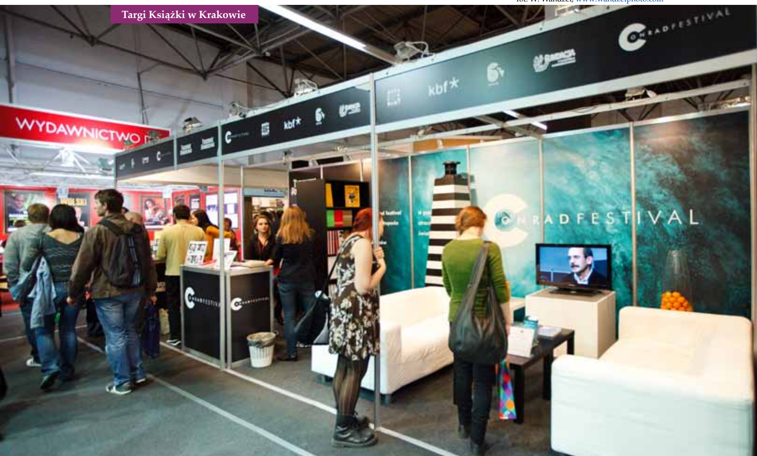
Targi Książki w Krakowie