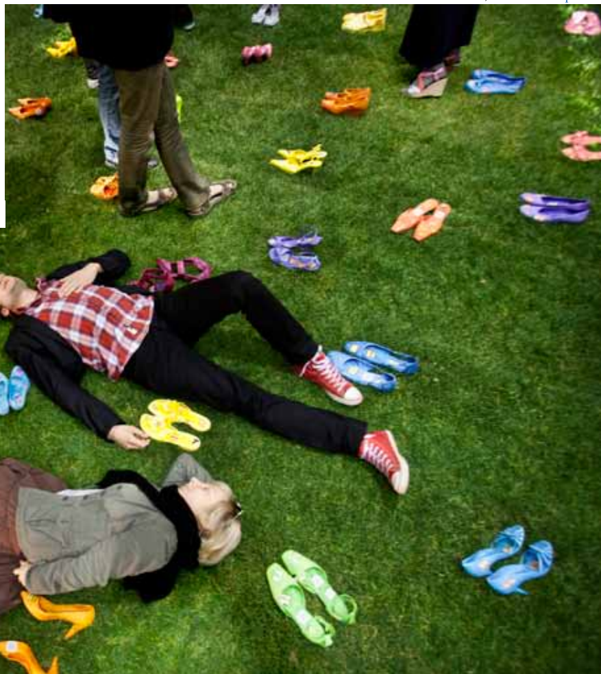
Wernisaż projektu Szpilki. Kobiety w kręgu Schulza