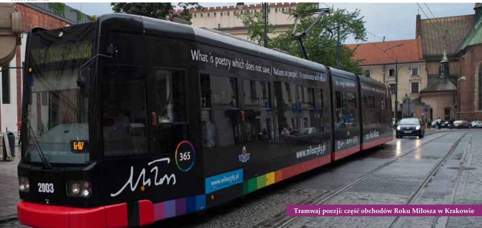
Tramwaj poezji: część obchodów Roku Miłości w Krakowie