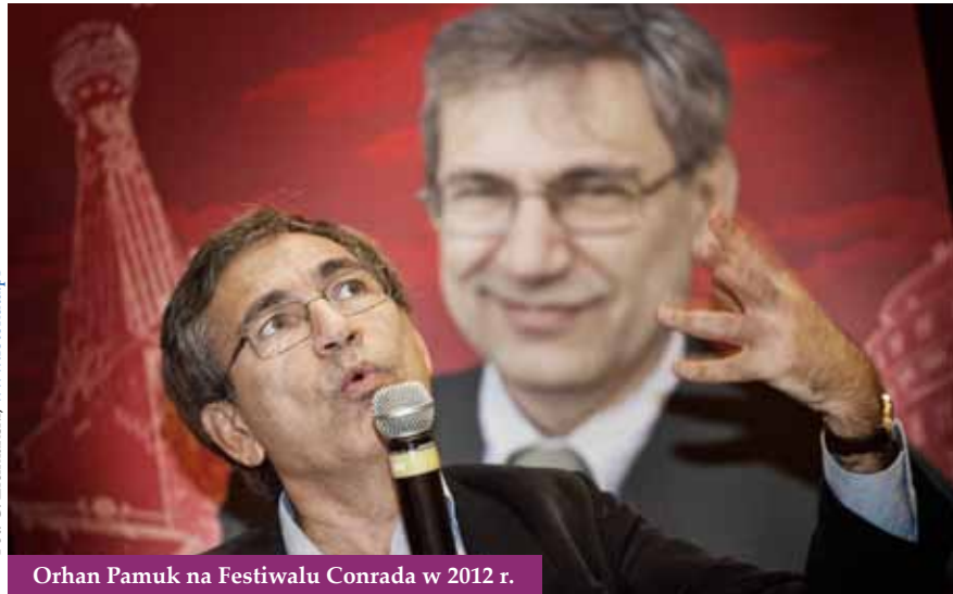
Orhan Pamuk na Festiwalu Conrada w 2012 r.