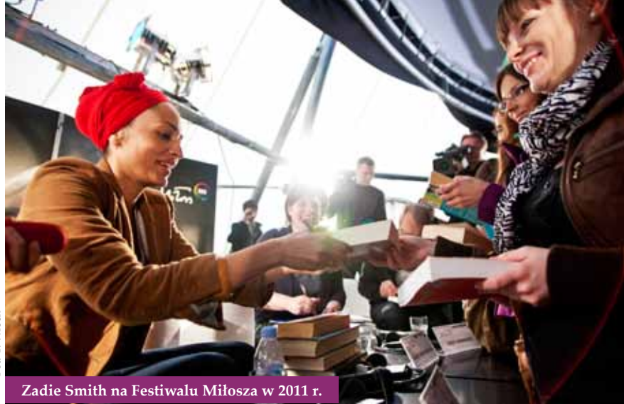
Zadie Smith na Festiwalu Miłosza w 2011 r.