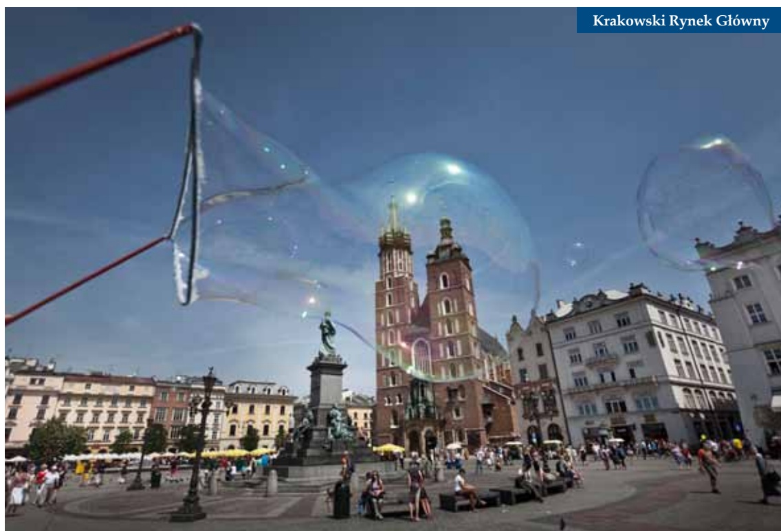
Krakowski Rynek Główny