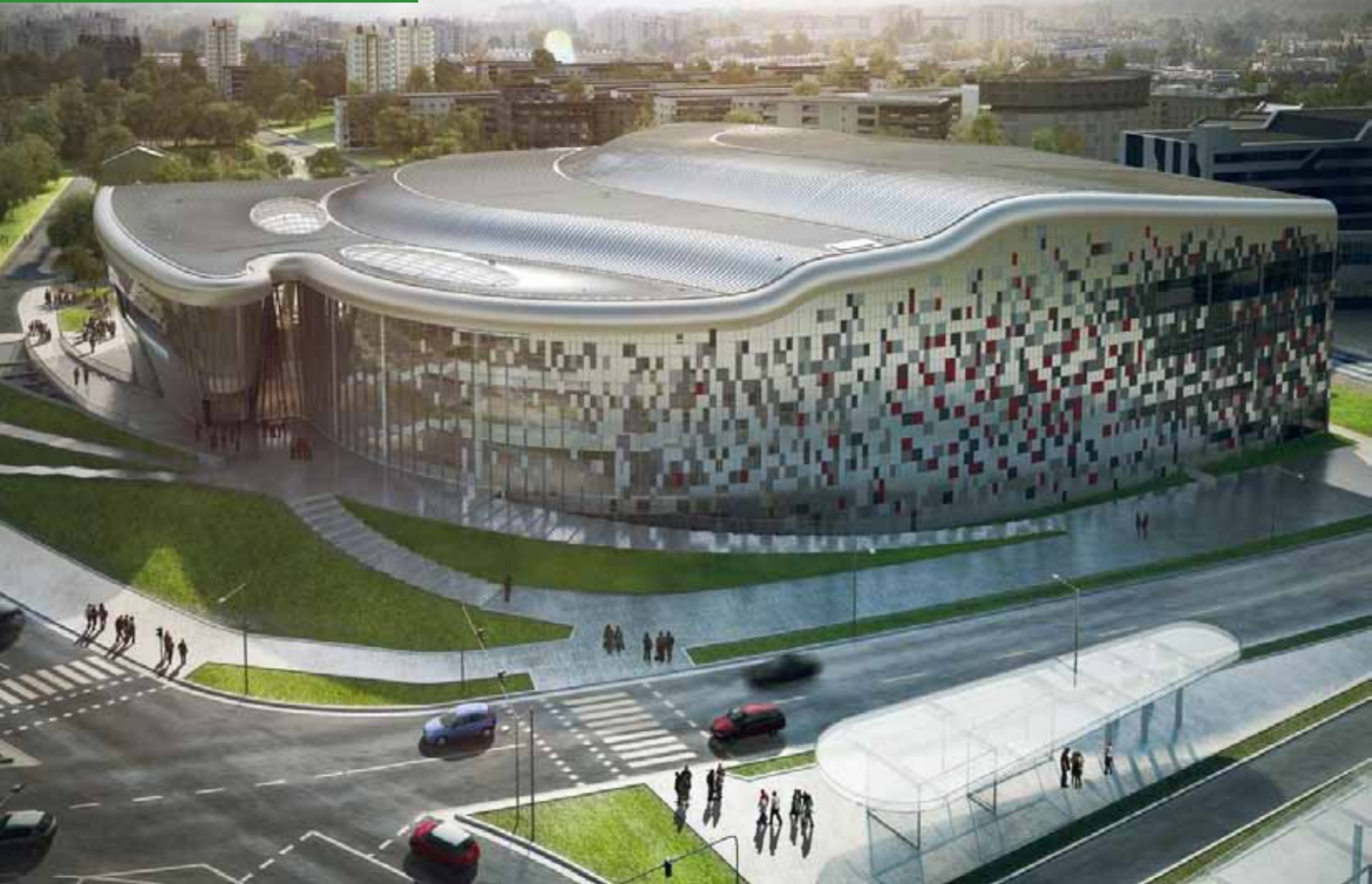
Dzięki uprzejmości Ingarden & Ewý – Architekci