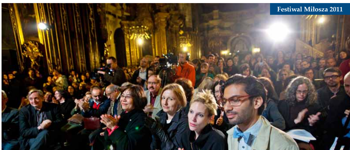
Festiwal Miłosa 2011