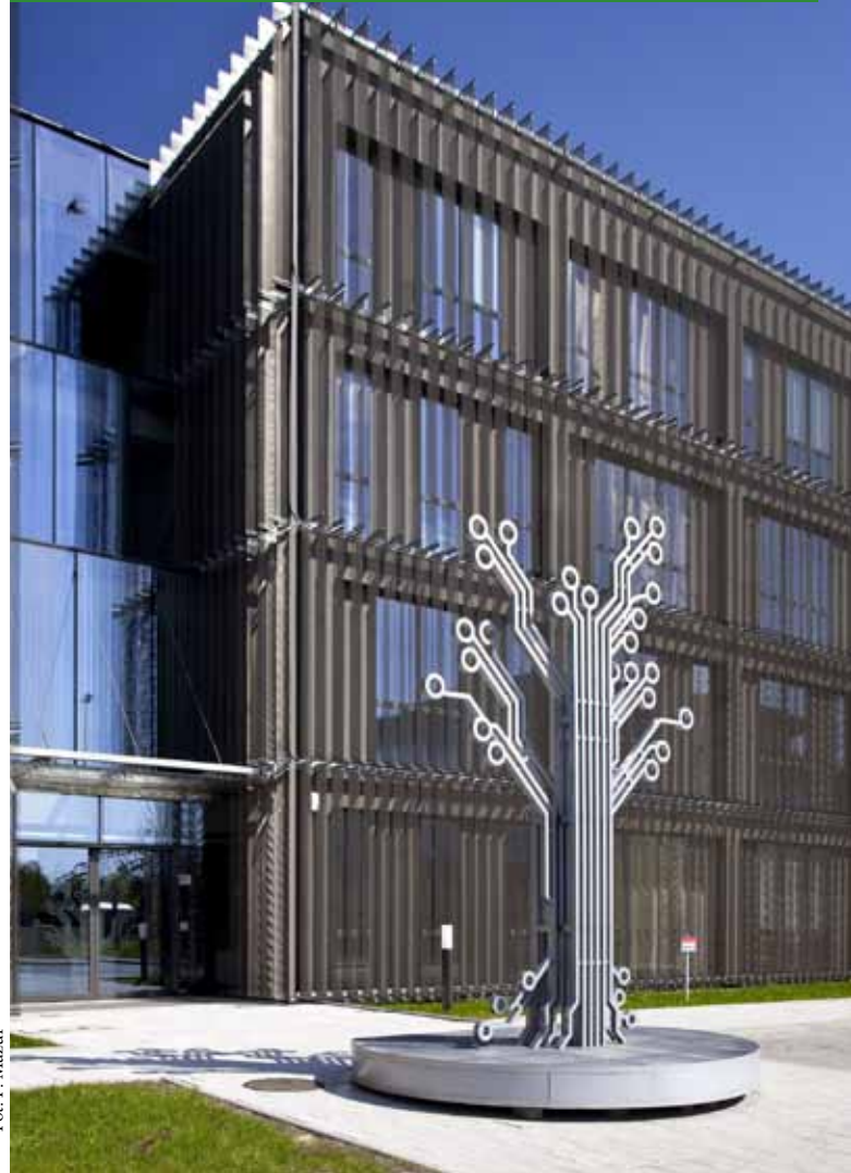
Krakowski Park Technologiczny oraz Drzewo Innowacji i Inwestycji