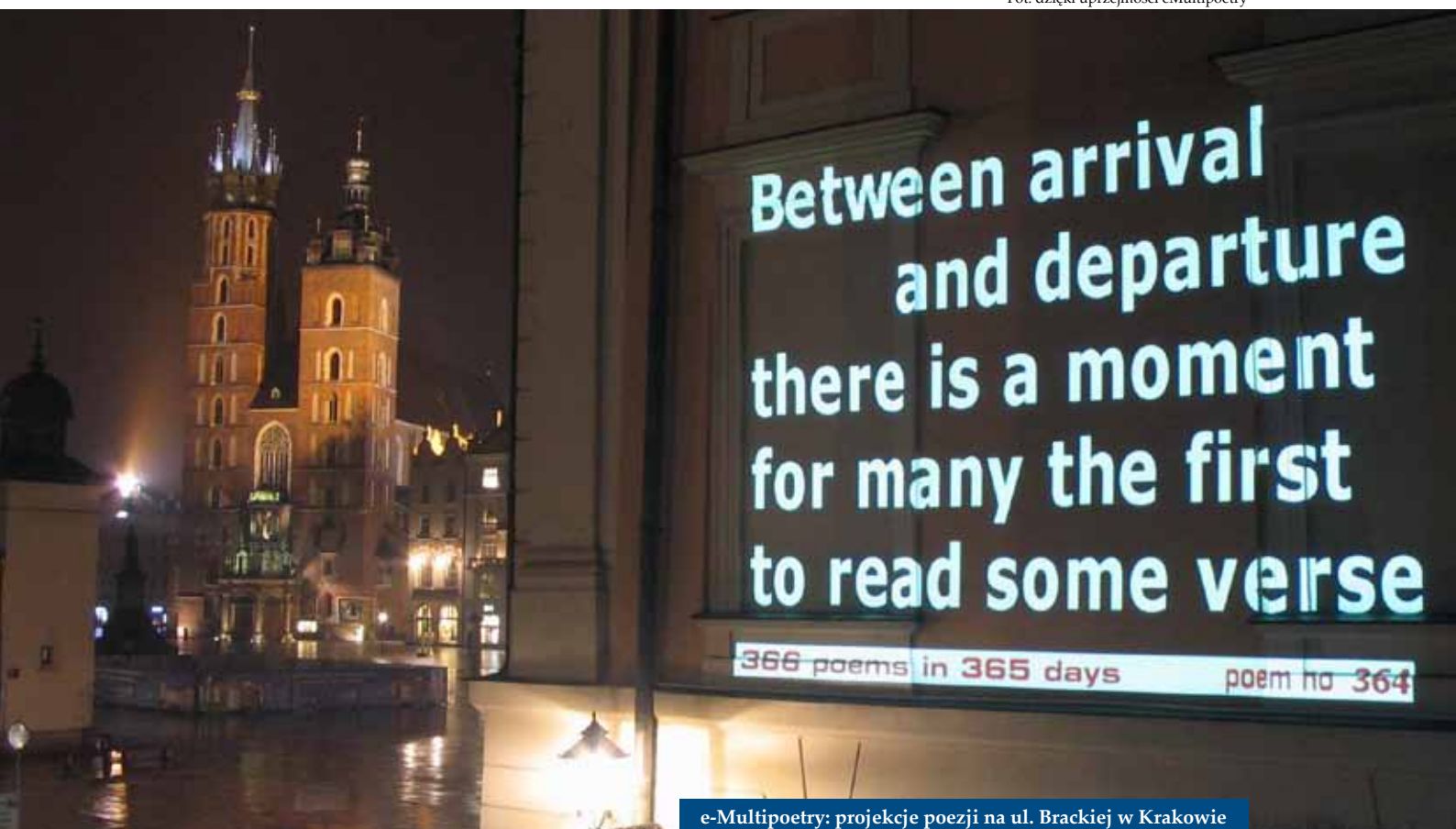
e-MultiPoetry: projekcje poezji na ul. Brackiej w Krakowie