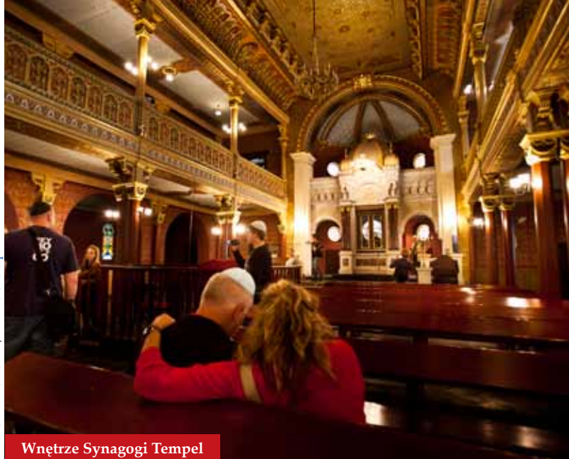
Wnętrze Synagogi Tempel